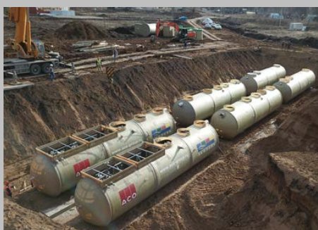
КОС ЭКО-Р-1000, ЖК "Цветы Башкирии", г. Уфа